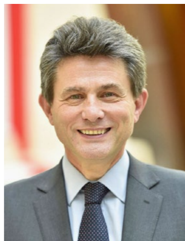
Henri de Castries Président des Mutuelles AXA

Nous vous souhaitons la bienvenue à nos côtés ! ”