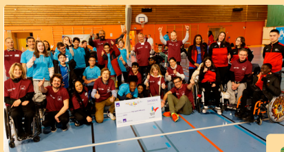
Jeux de l'Avenir IdF Handisport 2021 et 2023