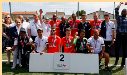
Finale de la Coupe de France de Cécifoot 2022